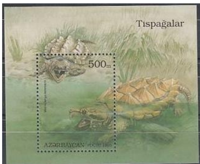
Tartaruga alligatore ( Macroclmys temminki )

La parola Ojibwe mikinaak con tutte le sue varie derivazioni (Mackinac, Machinaw, Mekanac) descriveva appunto le possenti tartarughe "azzannatrici" e "alligatore" appartenenti alla famiglia Chelydridae, diffuse dall'estremo nord sino al centro america.