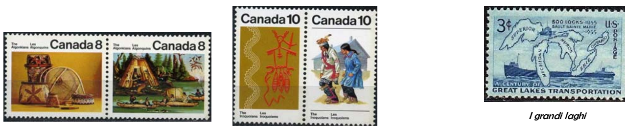
Tribù del Nord America

La parola Ojibwe mikinaak con tutte le sue varie derivazioni (Mackinac, Machinaw, Mekanac) descriveva appunto le possenti tartarughe "azzannatrici" e "alligatore" appartenenti alla famiglia Chelydridae, diffuse dall'estremo nord sino al centro america.