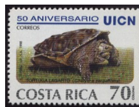
Tartaruga azzannatrice ( Chelidra sp. )

Queste grosse tartarughe d'acqua dolce del nord America, facevano parte del cibo abituale di queste tribù, che oltre a sfruttarne la carne ne utilizzava il carapace per creare strumenti musicali, o contenitori.