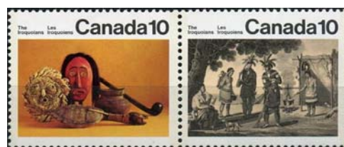
Guscio di chelidra usato come sonaglio