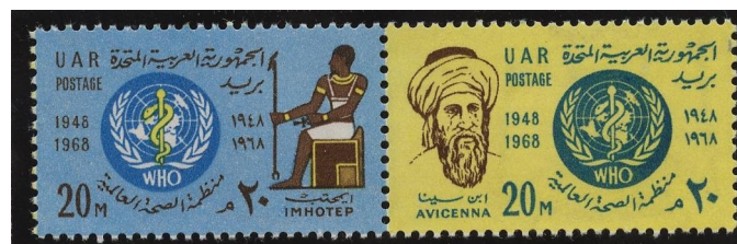
EGITTO U.A.R. - (1968) Y. 723 / 724 SE-TENANT

La sua reputazione medica arrivò fino a Nuh ibn Mansur, capo Samanide, che curò da una malattia. Come ricompensa, gli fu concesso di accedere alla Libreria Regale dei Samanidi, consentendogli lo sviluppo delle sue conoscenze in tutti i campi dello scibile.