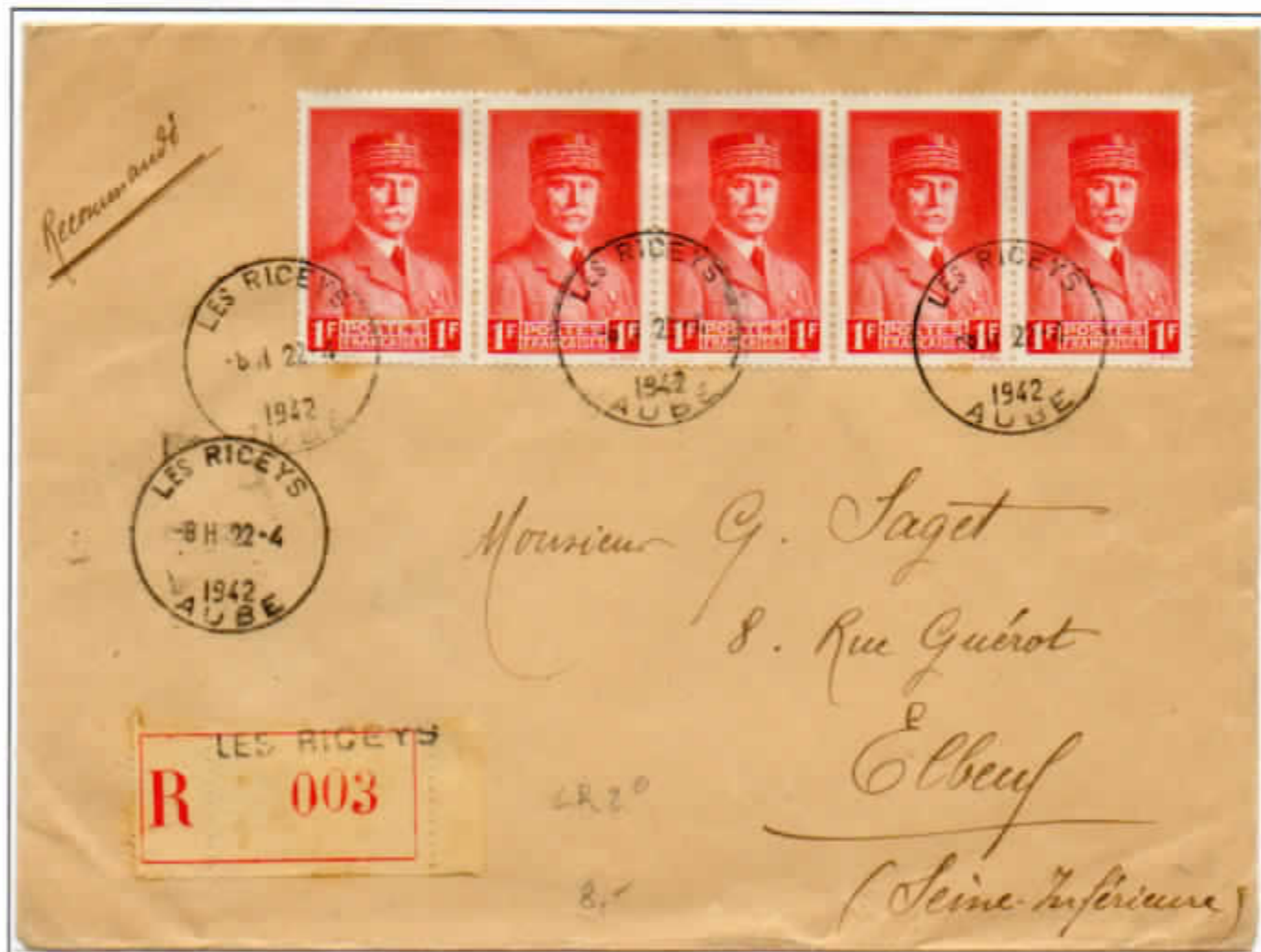
22.4.1942 - Raccomandata spedita da Les Riceys a Elbeuf (Senna Inferiore) affrancata con 5 fr (fr. 2,00 per 2° porto ordinario e fr. 3,00 diritto di raccomandazione).