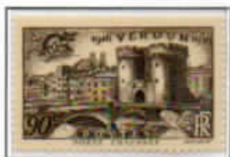
Castello di Verdun

Un bombardamento preciso e violento martellò per nove ore le postazioni transalpine.