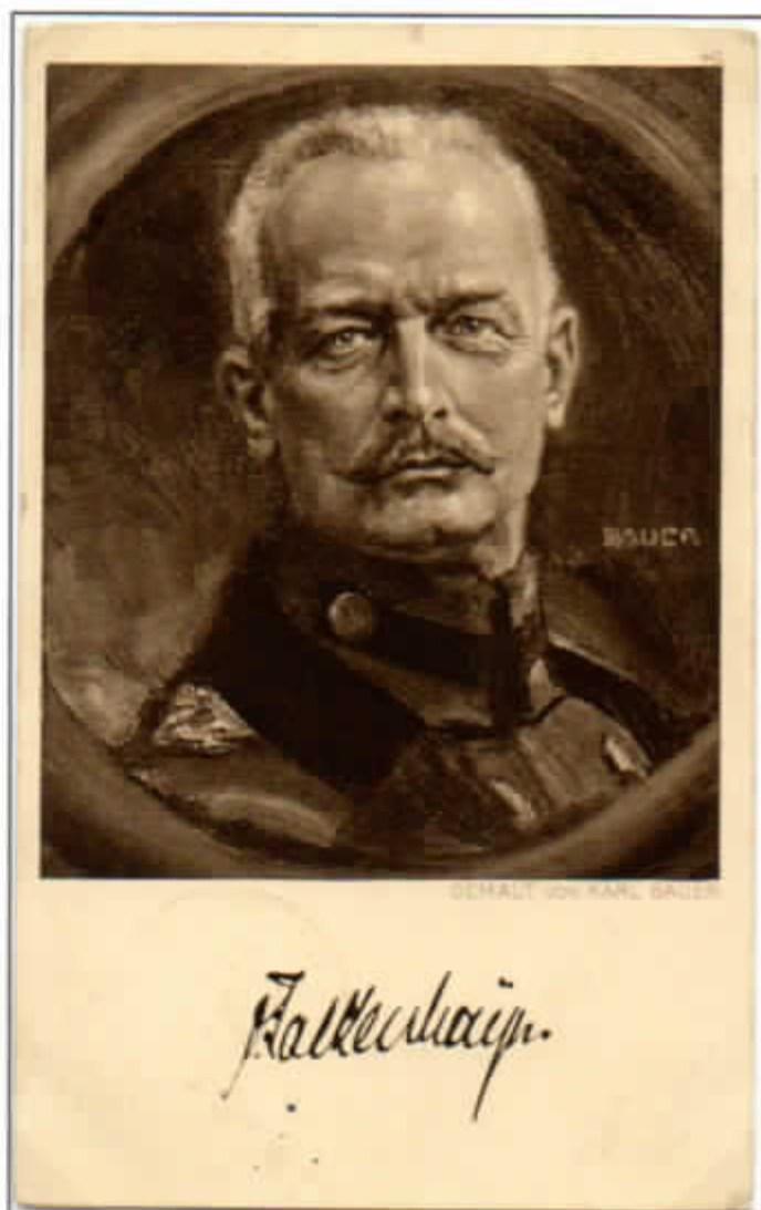
Cartolina postale tedesca in franchigia militare