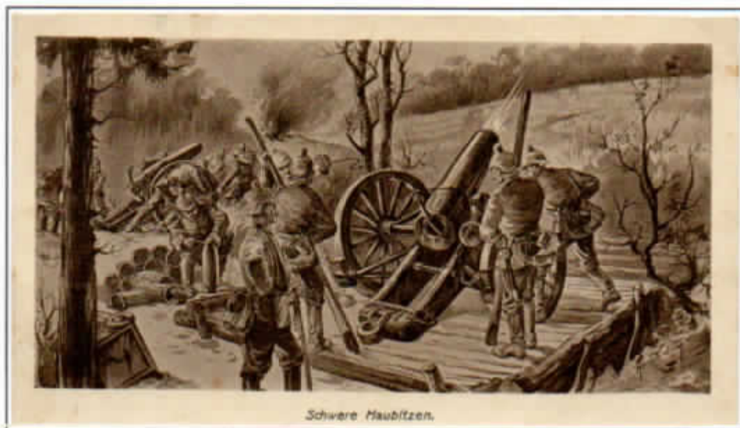
Cartolina postale tedesca in franchigia militare

Un bombardamento preciso e violento martellò per nove ore le postazioni transalpine.