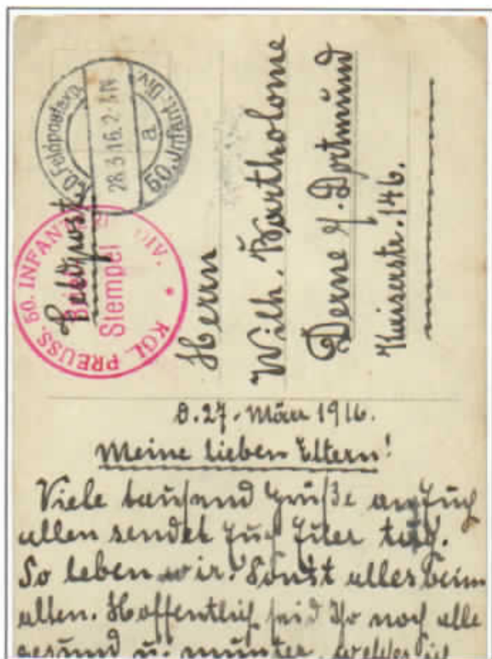
Cartolina in feldpost scritta da soldato tedesco, della 50 a Divisione di fanteria, presente a Verdun alla data del 28.3.1916.

In maggio i tedeschi comandati dal generale Erich Von Falkenhayn si prepararono a un nuovo balzo in avanti per occupare le future basi di partenza per l'assalto finale a Verdun, ossia l'estremità nord-est della linea francese.