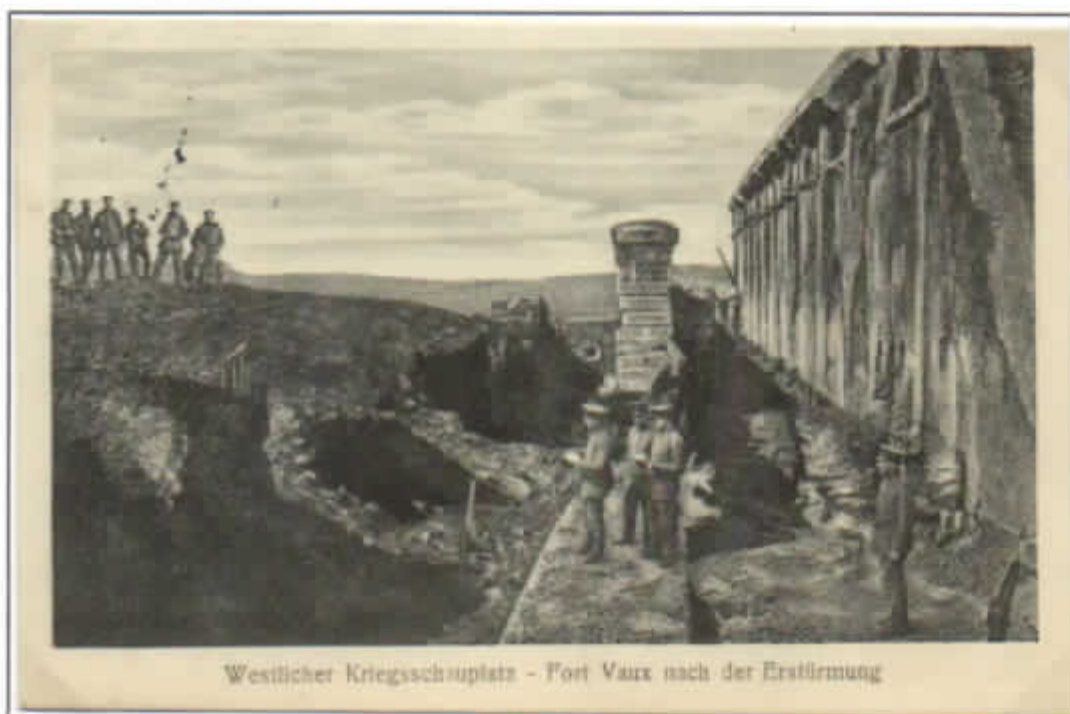
Westlicher Kriegsschauplatz - Fort Vaux nach der Erstürmung

Il 7 giugno cadde Fort Vaux , ma, nonostante ciò, il tentativo tedesco di impadronirsi di Verdun fallì con perdite elevate da entrambe le parti.