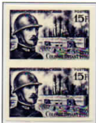
Saggi di colore

Il giorno dopo due battaglioni di fanteria, il 56° e 59°, comandati dal colonnello Emil Driant vennero quasi completamente annientati presso Verdun, dove morì eroicamente lo stesso ufficiale. L'attacco tedesco non sortì gli effetti sperati; tuttavia il 25 febbraio cadde uno dei luoghi simbolo di Verdun, Fort Douaumont .