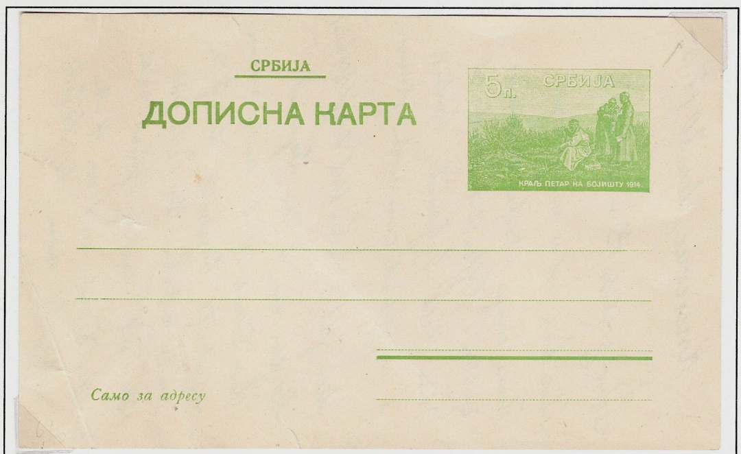
Serbia 1915. L'impronta mostra re Pietro in visita al fronte.