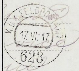
Cartolina austriaca della Isonzo Armee del 1915. In franchigia militare.