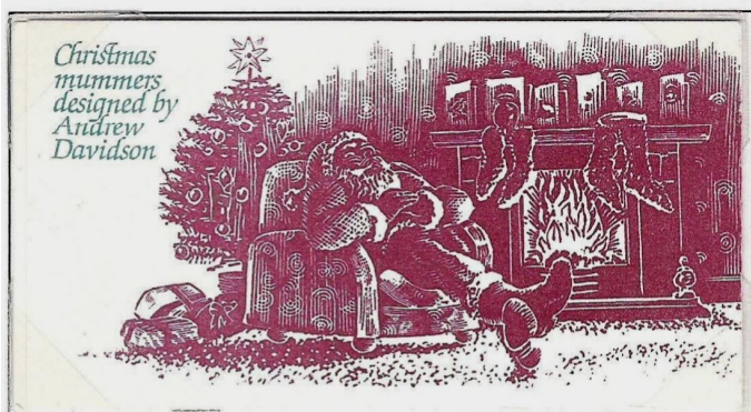
1982 Gran Bretagna – Libretto