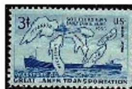
I grandi laghi

I nativi americani erano divisi in numerose tribù, nella zona dei grandi laghi al confine tra Canada e Stati Uniti i Chippewa o Ojibwe, Ottawa o Odawa e Potawatomi, Algonkians, Iroquois parlavano la lingua algonquiana .