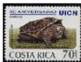
Tartaruga azzannatrice ( Chelonia sp.)

La parola Ojibwe mikinack con tutte le sue derivazioni (Mackinac, Machinaw, Mekanac) descriveva appunto le possenti tartarughe "azzannatrici" e "alligatore" appartenenti alla famiglia Chelydridae, diffuse dall'estremo nord sino al centro America.