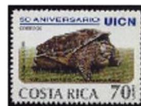
Tartaruga azzannatrice (Chelydra sp.)

La parola Ojibwe mikinack con tutte le sue derivazioni (Mackinac, Machinaw, Mekanac) descriveva appunto le potenti tartarughe "azzannatrici" e "alligatore" appartenenti alla famiglia Chelydridae, diffuse dall'estremo nord sino al centro America.