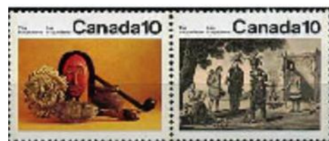
Guscio di chelidra usato come sonaglio

Queste grosse tartarughe d'acqua dolce del nord America erano parte del cibo abituale di queste tribù che, oltre a sfruttarne la carne, ne utilizzavano il carapace per creare strumenti musicali o contenitori.