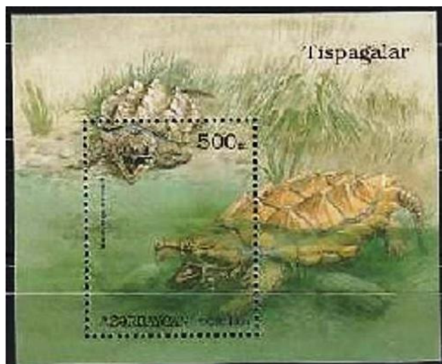
Tartaruga alligatore (Macrochelys temminckii)

La parola Ojibwe mikinack con tutte le sue derivazioni (Mackinac, Machinaw, Mekanac) descriveva appunto le potenti tartarughe "azzannatrici" e "alligatore" appartenenti alla famiglia Chelydridae, diffuse dall'estremo nord sino al centro America.