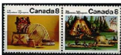
Tribù del Nord America