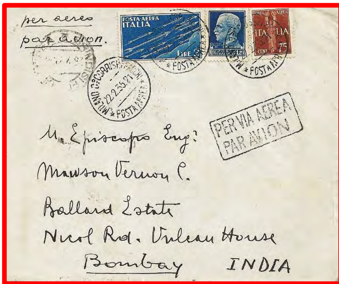
22.2.1935 - Lettera del primo porto spedita per via aerea da Milano a Bombay. Tariffa 4 lire. Lettera 1,25 lire, sopratassa aerea 2,75 lire.