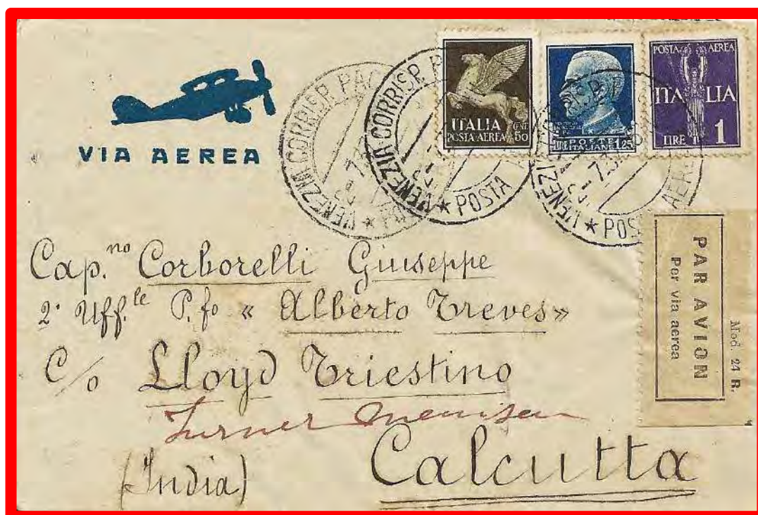
2.7.1937 - Lettera del primo porto spedita per via aerea da Venezia a Calcutta. Tariffa 2,75 lire. Lettera 1,25 lire, sopratassa aerea 1,50 lire, per i primi 5 gr. di peso.