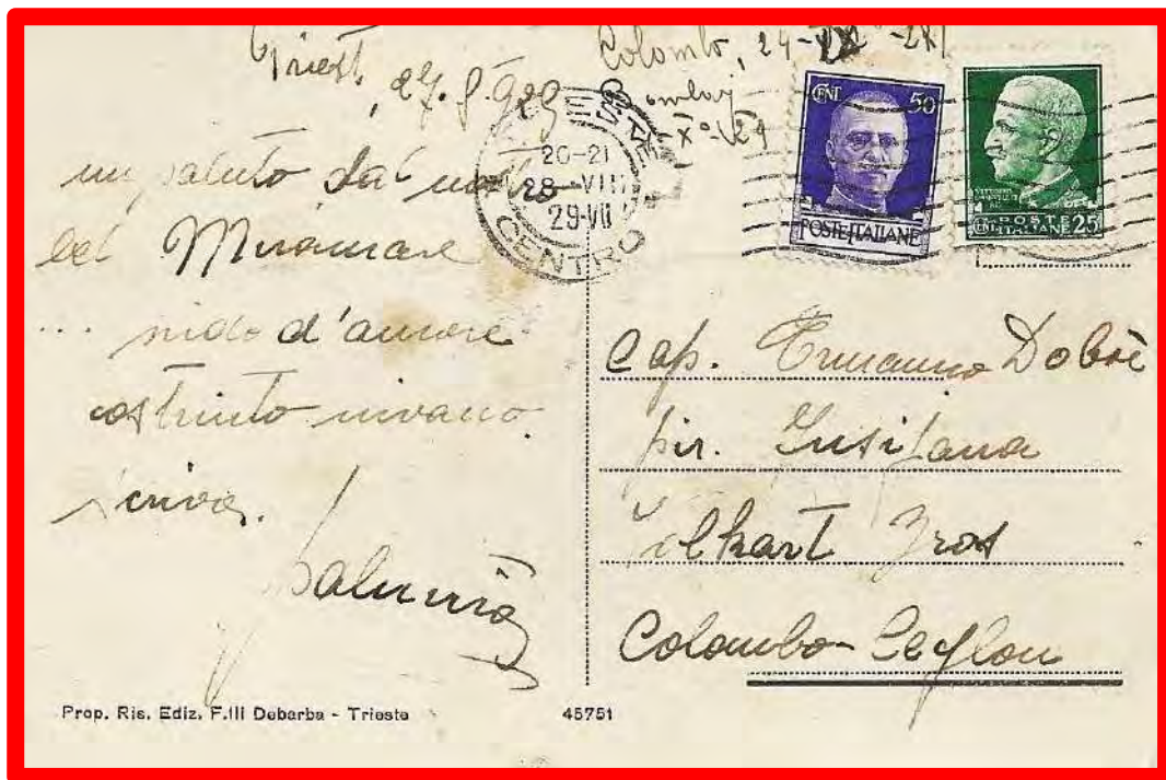
28.8.1929 - Cartolina illustrata spedita da Trieste a Colombo, Ceylon. Indie Britanniche. Tariffa 0,75 cent..