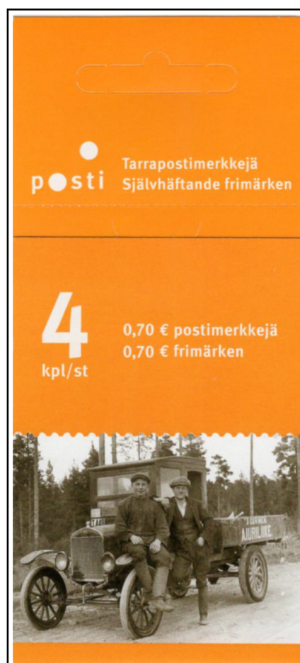
Finlandia, 2007 - Libretto contenente 4 francobolli da 0,70 €.